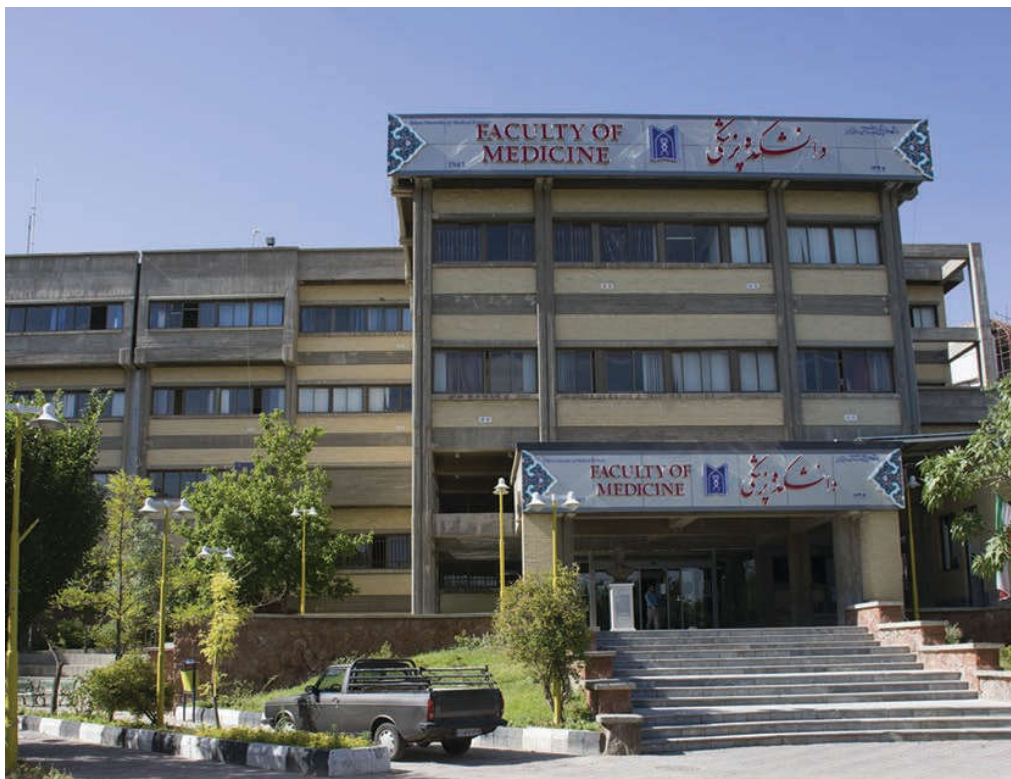
ساختمان جدید دانشکده پزشکی