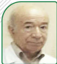
پدر جراحی آذربایجان گروه جراحی