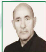
گروه جراحی قلب و توراکس