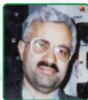
بنیان گذار پیوند کلیه گروه ارولوژی