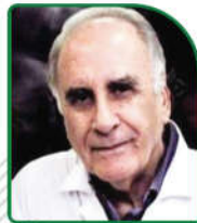
پدر رادیولوژی ایران گروه رادیولوژی