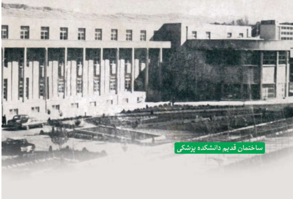
ساختمان قدیم دانشکده پزشکی