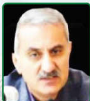
بنیان گذار گروه طب اورژانس