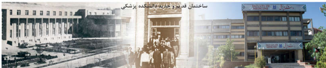
ساختمان قدیم و جدید دانشگاه پزشکی