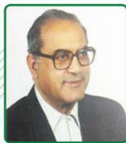
بنیان گذار بخش توراکس گروه جراحی قلب و توراکس