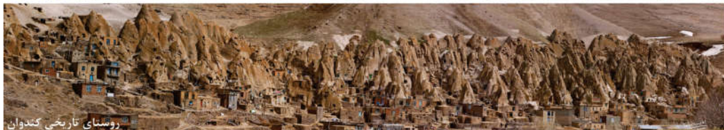
روستای تاریخی کندوان